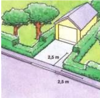
Utfart mot gata

Varje år skadas människor i onödan för att sikten skymms. Den växtlighet som hör till tomtmarken ska hållas innanför tomtgräns, annars inkräktar den på det utrymme som i de flesta fall är avsett för gångtrafiken.